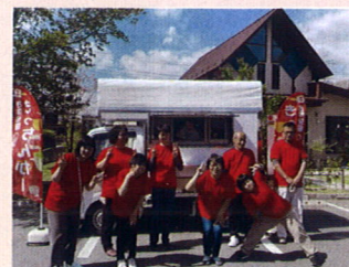
キッチンカーで新たな挑戦！